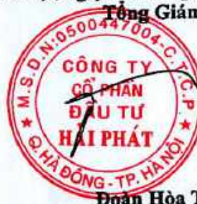
Đoàn Hòa Thuận