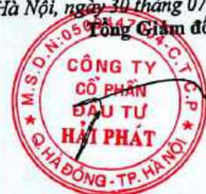
Đoàn Hòa Thuận