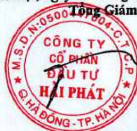
Đoàn Hòa Thuận