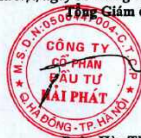
Đoàn Hòa Thuận