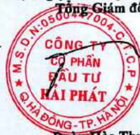
Đoàn Hòa Thuận