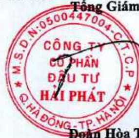
Đoàn Hòa Thuận