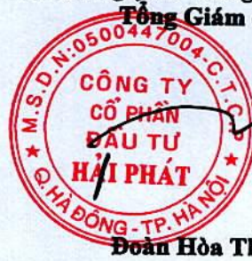
Đoàn Hòa Thuận