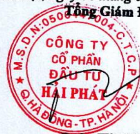
Đoàn Hòa Thuận