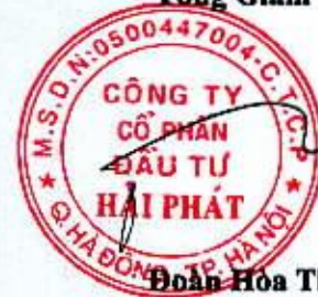
Đoàn Hòa Thuận