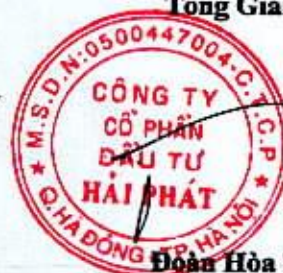
Đoàn Hòa Thuận