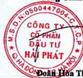
Đoàn Hòa Thuận